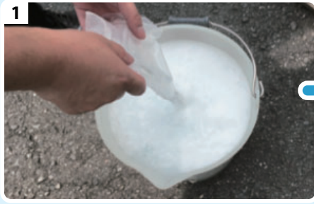
1 Z.E.M.Vを50℃以上のお湯、または水で溶かす。