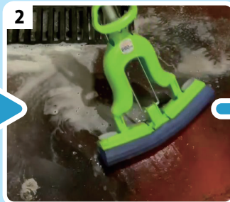
2 こすった後、水分をはけると...