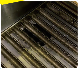
油汚れがびっしりとこびりついた 換気扇