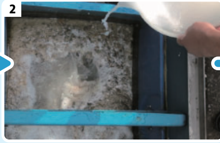
2 溶かしたZ.E.M.Vをグリストラップに投入する。