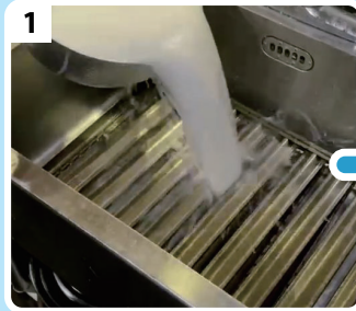
1 お湯に溶かしたZ.E.M.Vを 換気扇にまんべんなくかける。