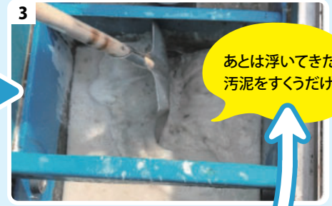
3 軽くかき回して、15～30分程度置く。