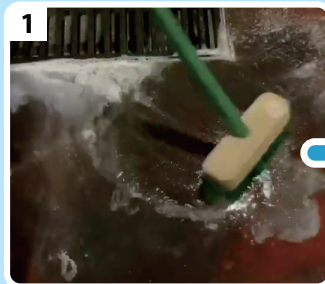
1 お湯に溶かしたZ.E.M.Vを床にかけ しばらく置いてから軽くこする。