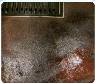
長年こびりついて黒くなった油汚れ