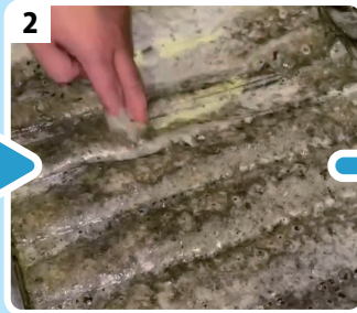
2 しばらくつけ置き。つけておくだけで かなりの油がはがれてくる!